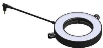
Кольцевая светодиодная подсветка (опция)

Для получения полного описания опций освещения Inspectis, пожалуйста, обратитесь к руководству по эксплуатации.