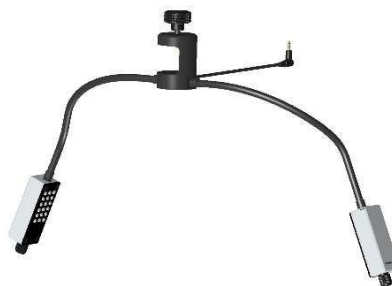
Двойная светодиодная подсветка (опция)