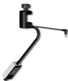
Матричная светодиодная подсветка (опция)